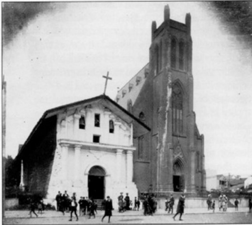
Mission Dolores and Basilica, 1890s.

La Misión Dolores quedo intacta después del terremoto de 1906, que destruyó toda la ciudad de San Francisco de California.