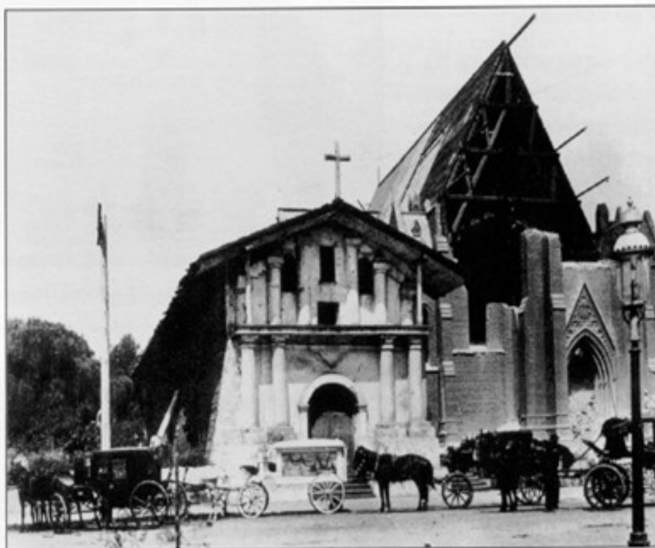
Mission Dolores and Basilica, 1906.

La Misión Dolores quedo intacta después del terremoto de 1906, que destruyó toda la ciudad de San Francisco de California.