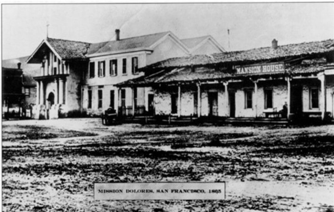
MISSION DOLORES, SAN FRANCISCO, 1865

La planificación, creatividad, y visión de Fray Cambón, nos legó la supervivencia de las singulares y espléndidas construcciones de la Misión San Francisco de Asís.