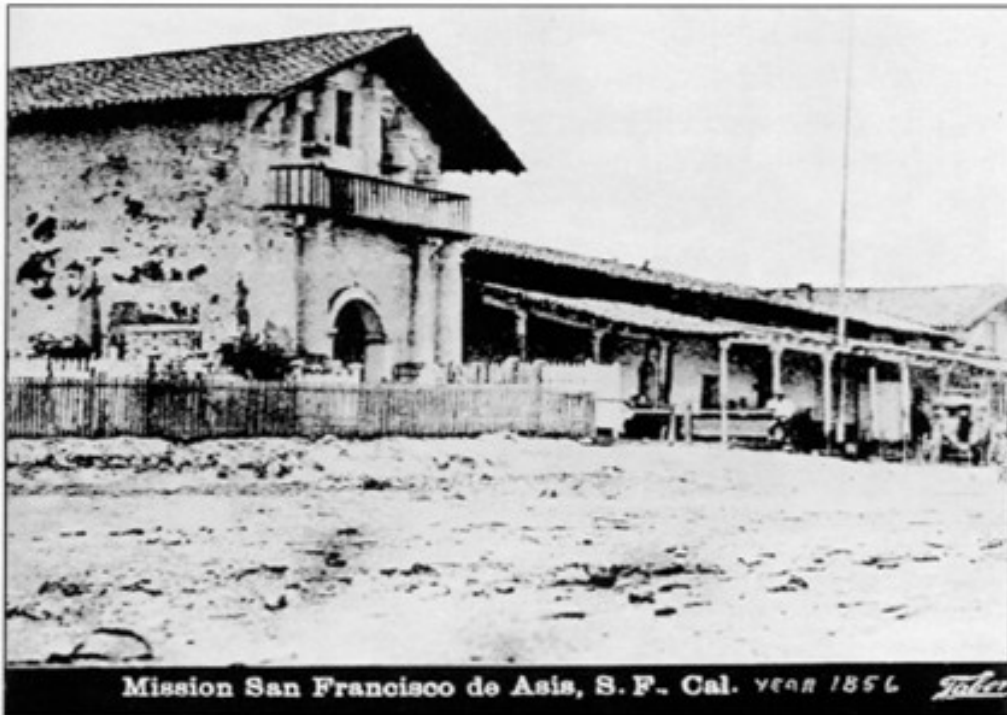
Mission San Francisco de Asis, S. F., Cal. year 1856 Stalco