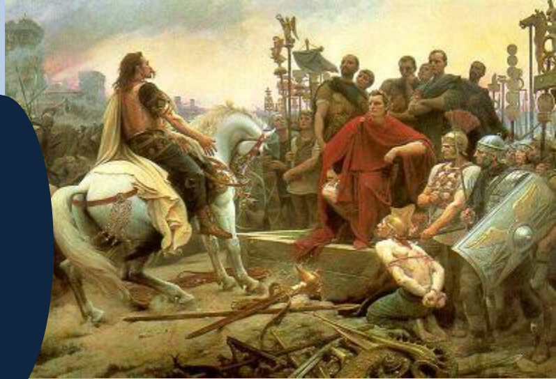
BERGINCETORIS RINDIENDO EL SITIO DE ALESIA A CESAR.

El año 57 Julio Cesar conquistó el país al que denominó Galia Bélgica. Sin embargo la colonización romana sólo alcanzó importancia relevante en la región central y meridional por su situación fronteriza dentro del imperio romano la Galia Bélgica padeció numerosas invasiones y ya a principios del siglo V estaba ocupada parcialmente por los francos, pueblo germánico que más tarde se extendió por el resto del país. El reino de Bélgica, ya en el siglo XIX por la constitución de 1831, adoptó como forma de gobierno la monarquía parlamentaria y hereditaria por línea masculina y se ofreció la corona al alemán Leopoldo de Sajonia-Coburgo.